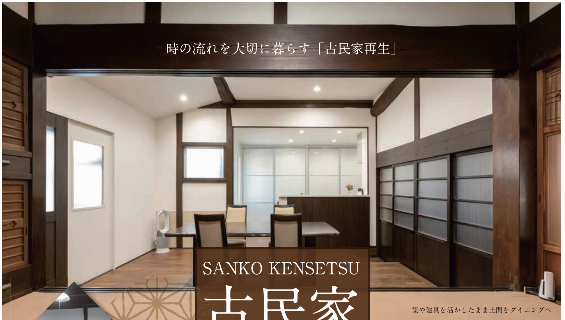
梁や建具を活かしたまま土間をダイニングへ